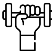
Práctica de deporte