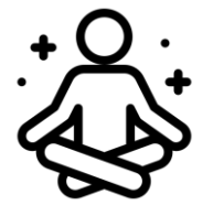
Manejo del estrés