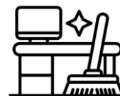
Orden y aseo