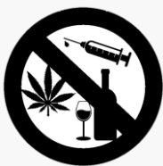
Prevención del consumo

En la Entidad se promueven mediante actividades formativas y lúdicas la incorporación de estilos de vida y hábitos saludables, como: